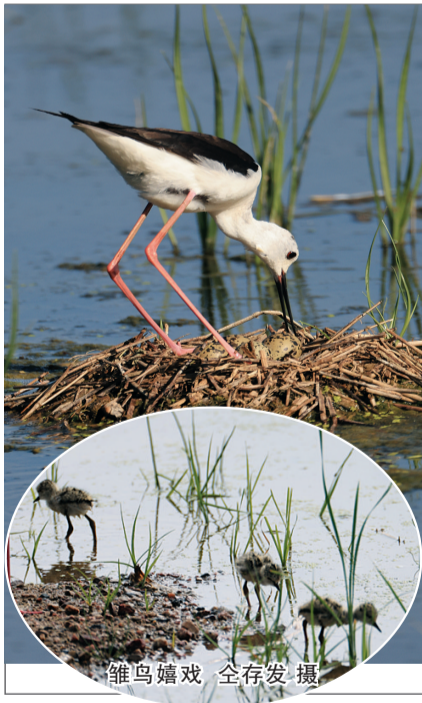
雏鸟嬉戏

黑翅长脚鹬的建巢繁殖是湿地生态环境持续向好的有力见证。近年来，广灵壶流河湿地通过实施围堰蓄水、植被修复等一系列生态保护措施，成为黑翅长脚鹬及众多候鸟理想的繁殖栖息地。