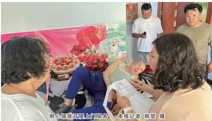
耐心细致开展上门服务