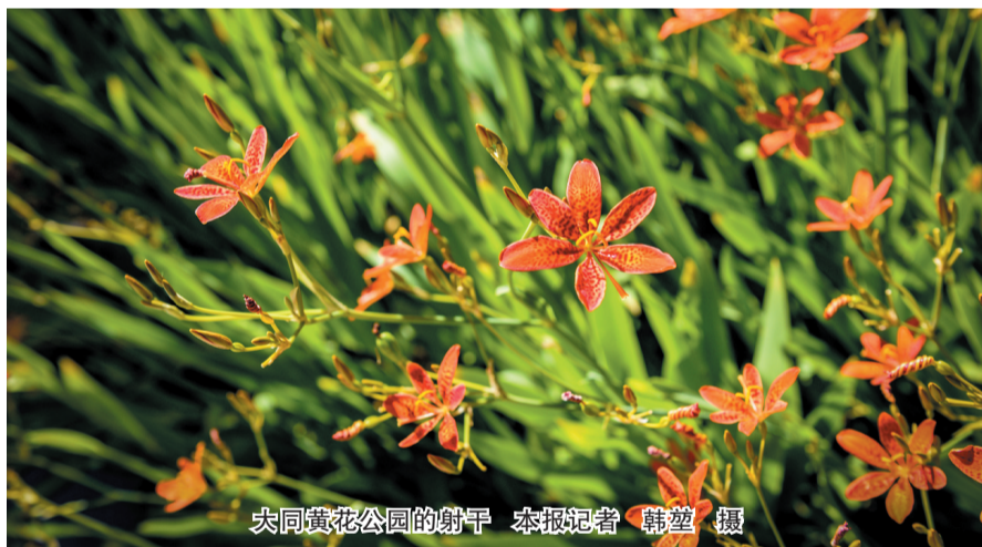
大同黄花公园的射干

据市城市公园服务中心专业技术人员介绍,射干不仅观赏性强,而且适应能力突出。它耐寒耐旱,对土壤要求不