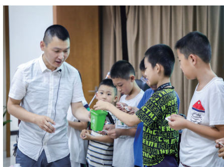
活动现场

本报讯(记者 丁亚琴)7月12日,“科普在身边·百姓讲堂”系列活动第三期在市图书馆开讲。本次活动邀请中科院植物研究所博士、大同大学煤基生态碳汇技术教育部工程研究中心副教授张晓担任主讲人,以“看我七十二变——神奇的垃圾变形记”为主题,为青少年带来一堂生动的环保科普课。