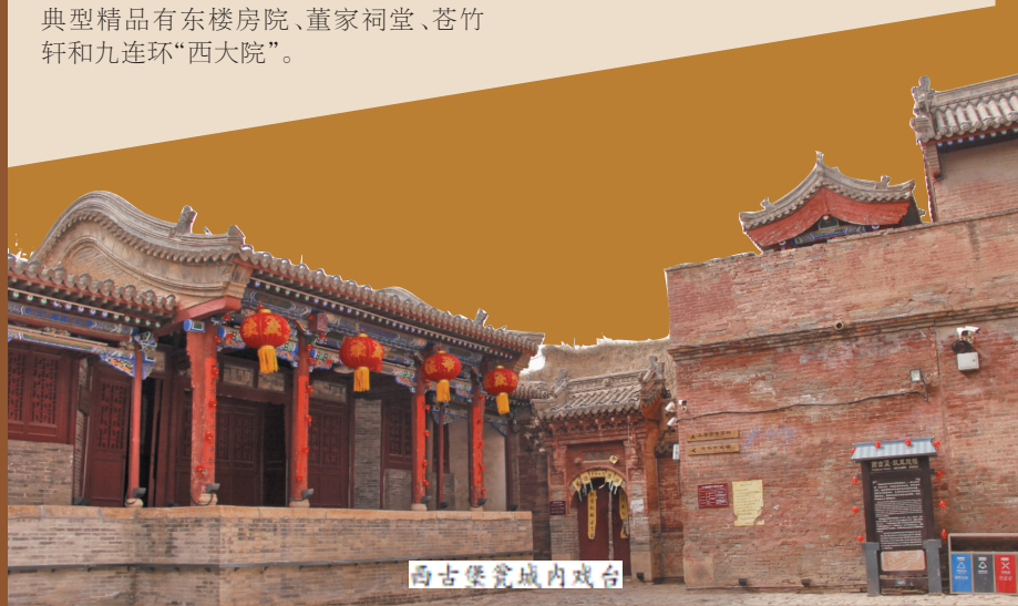
西古堡瓮城内戏台