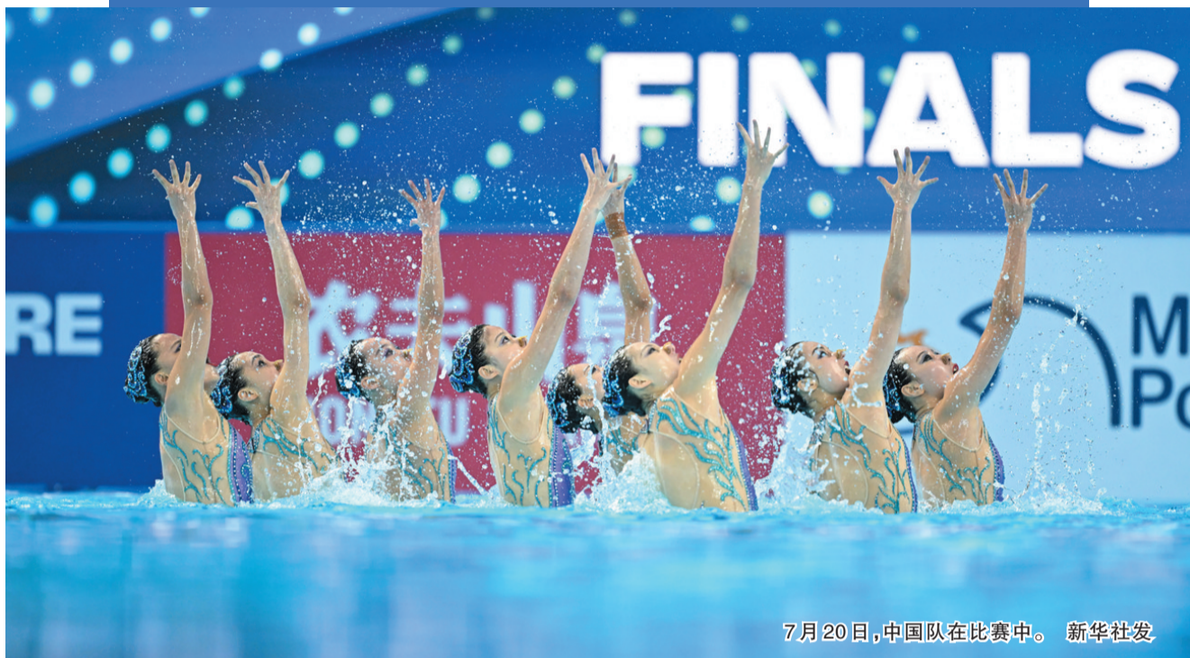
7月20日,中国队在比赛中。

新华社新加坡7月20日电 20日在2025年新加坡游泳世锦赛赛场,奥运冠军冯雨、常昊、向玢璇领衔中国花样游泳全新阵容亮相,中国队再现巴黎奥运会夺冠曲目《万有引力》,以绝对优势夺得集体自由自选项目金牌。