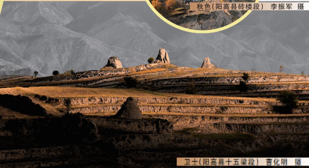
卫士(阳高县十五梁段)