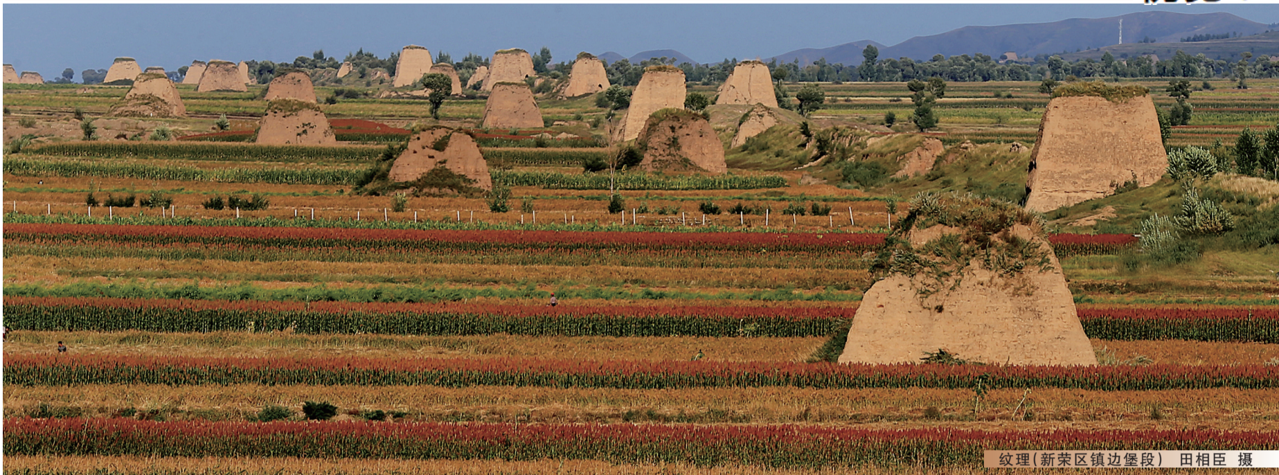
纹理(新荣区镇边堡段)