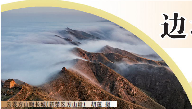
云雾方山瞰长城(新荣区方山段)