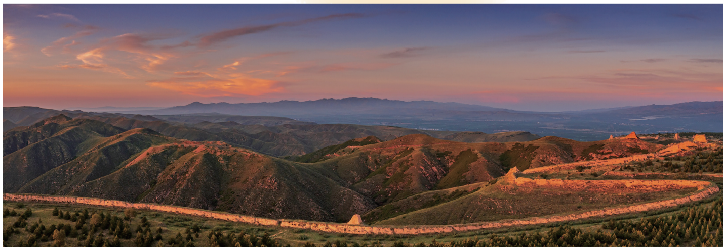
霞光(新荣区方山段)