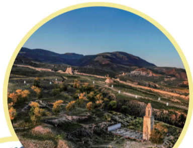
八台子(左云县)