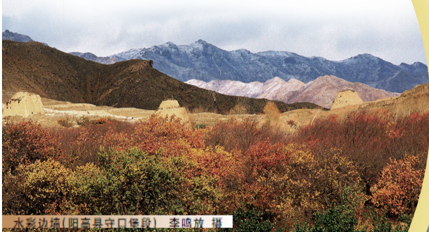
水彩边墙(阳高县守口堡段)