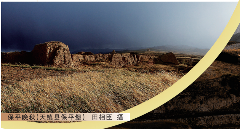
保平晚秋(天镇县保平堡)