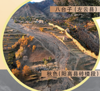
秋色(阳高县砖楼段)