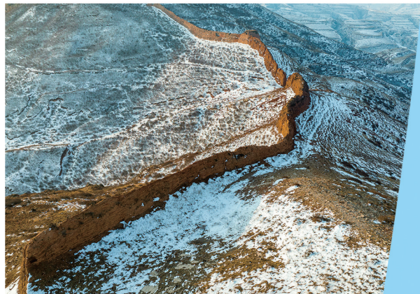
北齐长城(广灵县段)