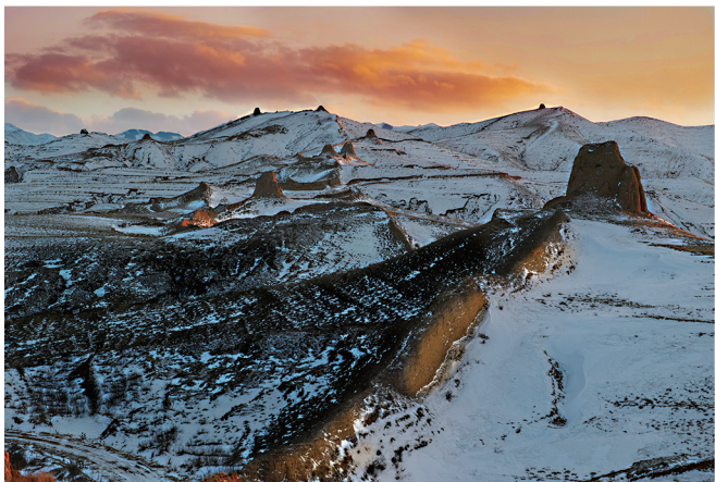
雄关如铁(天镇县新平堡段)