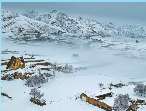
天地苍黄(阳高县十五梁段)