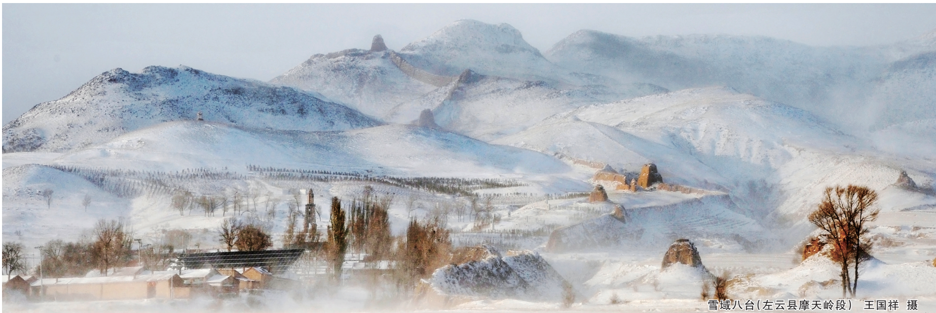
雪域八台(左云县摩天岭段)