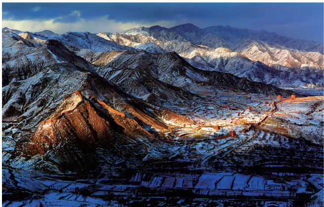
苍龙镇边关(阳高县守口堡段)