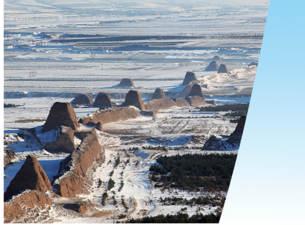
长龙卧雪(新荣区镇川口段)