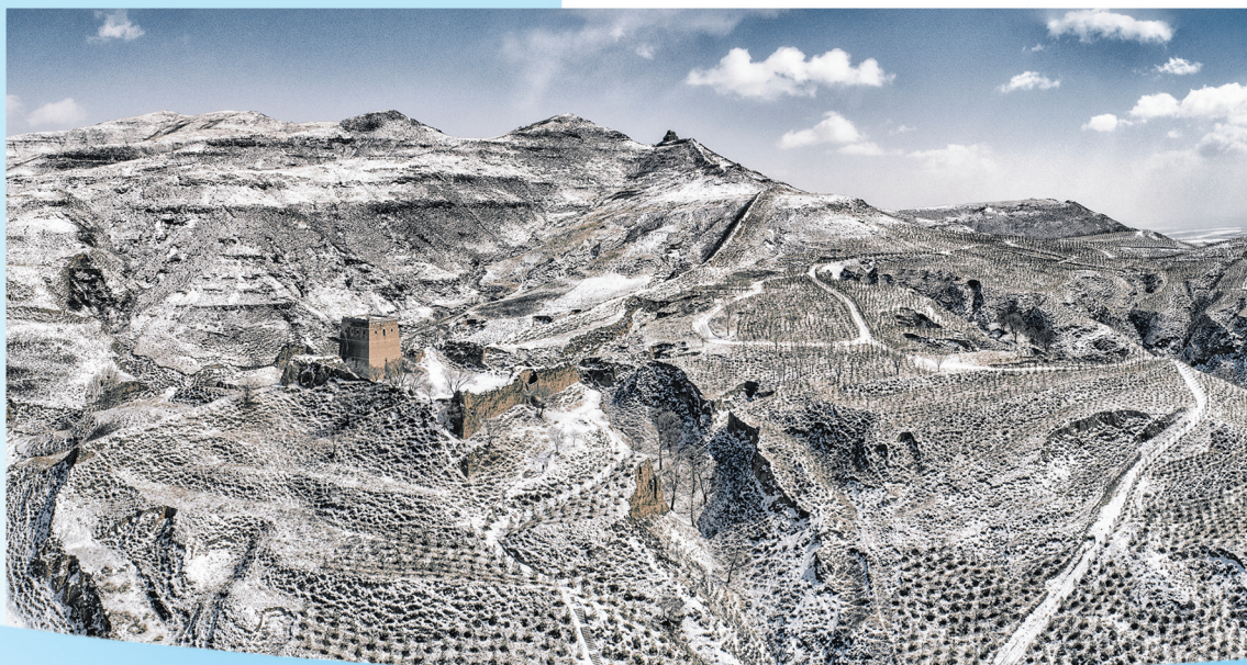
千年坚守(左云县摩天岭段)