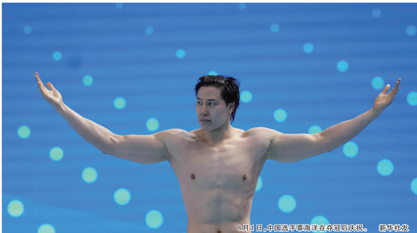
8月1日,中国选手覃海洋在夺冠后庆祝。