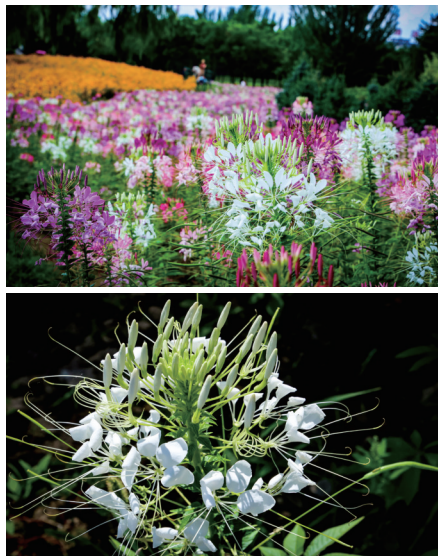
文瀛湖风景区的醉蝶花

近日，记者走进文瀛湖风景区，成片的醉蝶花美不胜收。醉蝶花的花梗长而壮实，花茎细长，花朵呈开放式，由4枚椭圆形花瓣组成扇形，数条细长的花蕊从花瓣中间伸出并下垂，形似展翅的蝴蝶。醉蝶花自下而上一层层绽放，形成一个丰满的花球。花丛中，蜜蜂忙着采蜜，蝴蝶翩翩起舞，构成一幅极美的生态画卷。