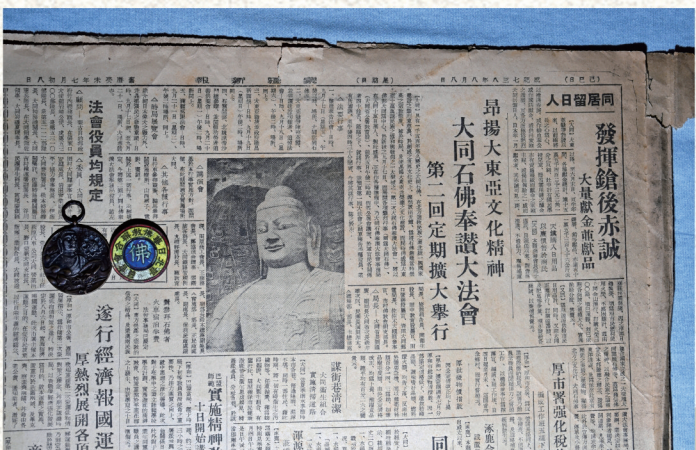
侵华日军占领大同利用宗教统治大众