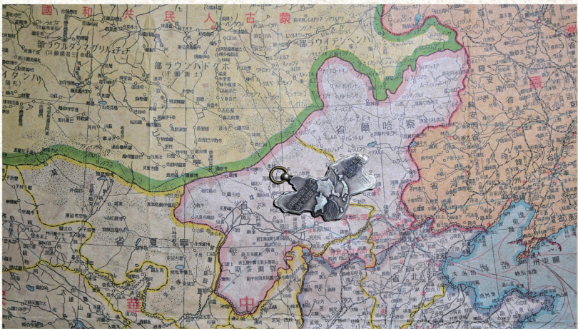
侵华日军建立蒙满政府并制作纪念章