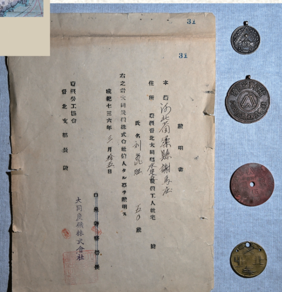
侵华日军抓捕劳工并制作铭牌