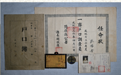
侵华日军在大同实行严酷的户籍管理