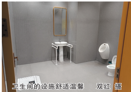
卫生间的设施舒适温馨