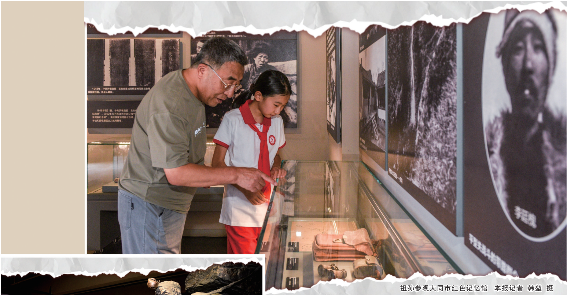
祖孙参观大同市红色记忆馆