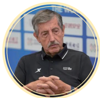
何塞·佩鲁雷纳接受专访

成都世运会上，龙舟、武术等中国传统体育项目被纳入竞赛日程。何塞认为，这是本次赛事的重要成就之一。“这些项目承载着非常丰厚的文化积淀，是中国引以为傲的传统体育项