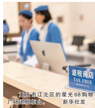
重庆市江北区的星光68购物广场退税柜台。

针对入境研学旅游热潮，业内人士提出，要加强培育熟悉客源市场文化背景、具备跨文化交流能力的专业人才；进一步打通学校、企业与旅行社的合作渠道，鼓励高科技企业、科研机