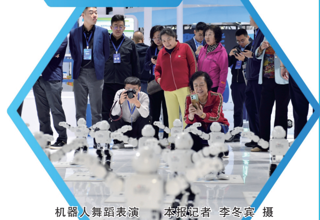
机器人舞蹈表演