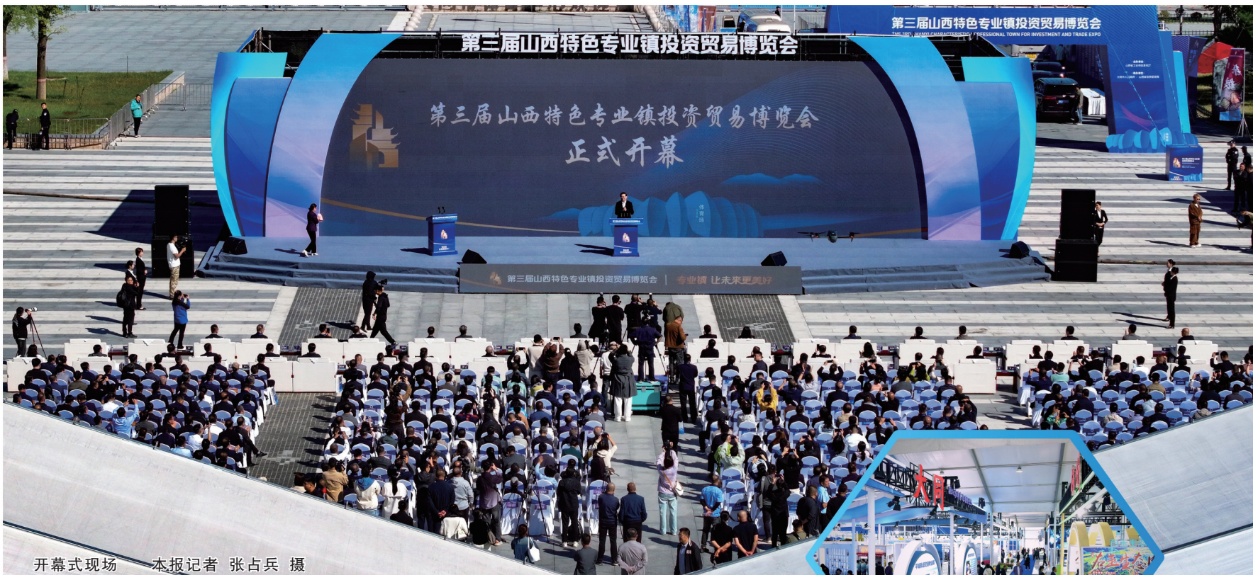
开幕式现场

本报讯（记者 韩云峰）17日上午，第三届山西特色专业镇投资贸易博览会在大同市体育中心开幕。