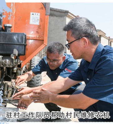
驻村工作队员帮助村民维修农机