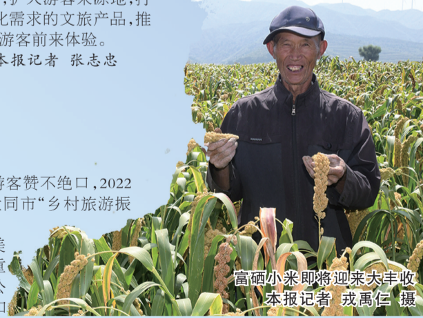
富硒小米即将迎来大丰收