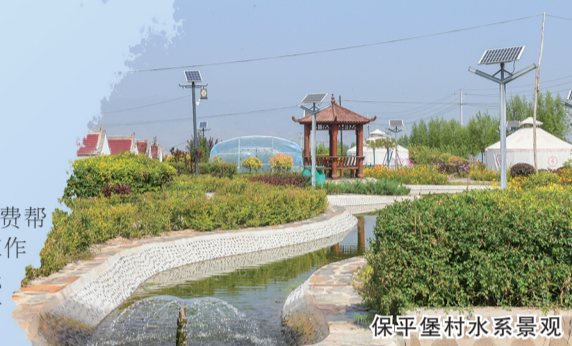
保平堡村水系景观