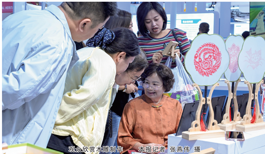
观众欣赏木雕制作

大同展厅则以非遗匠心与科技融合，吸引众多观众感受大同文旅魅力。展厅汇聚广灵剪纸、灵丘麦秆画、浑源文创等多种