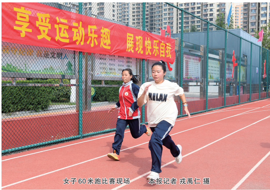
女子60米跑比赛现场

趣味运动会的举办，不仅为特殊儿童搭建了展示自我的平台，让他们在运动中收获快乐、实现成长，更帮助他们在协作比拼中学会合作、分享与尊重，为未来的学习生活与社会适应奠定坚实基础。