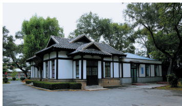
日本神社附属用房旧址