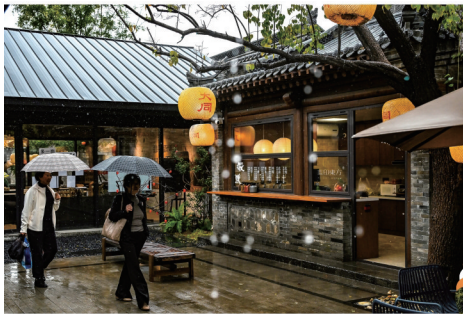
东南邑游人悠然雨中行