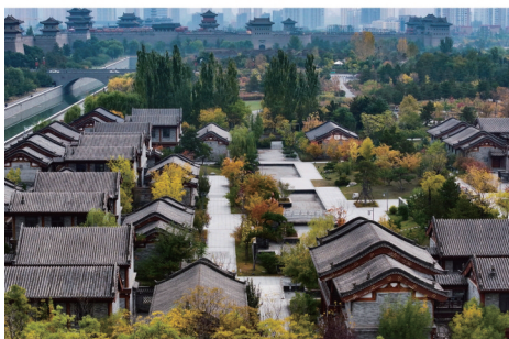
谐趣园古建筑群落秋意浓