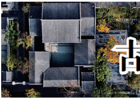
古城院落金叶秋韵浓