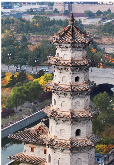
红黄秋叶色彩斑斓