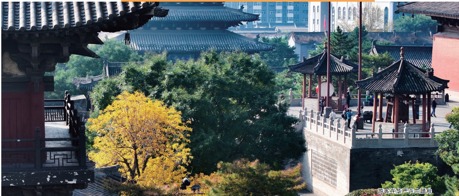
游客在华严寺内寻秋