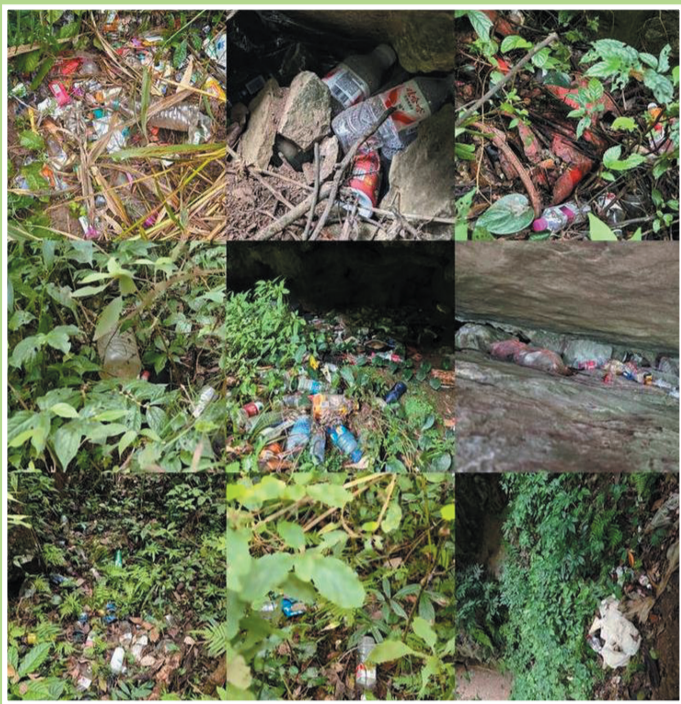
▲西南山区某瀑布附近，铁皮桶、食用油桶和矿泉水瓶等垃圾散落四周。