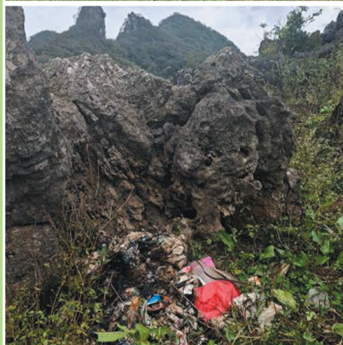
▲西部山区某三处小众景点都有就地焚烧垃圾的痕迹。

塑料水瓶、易拉罐、食用油桶、食品包装袋、塑料袋、一次性餐盒、废旧帐篷……近日，“新华视点”记者调查发现，在一些小众景点或徒步路线附近的山林间、河道里，不少垃圾肆意散落，触目惊心。