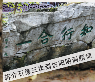
蒋介石第三次到访阳明洞题词