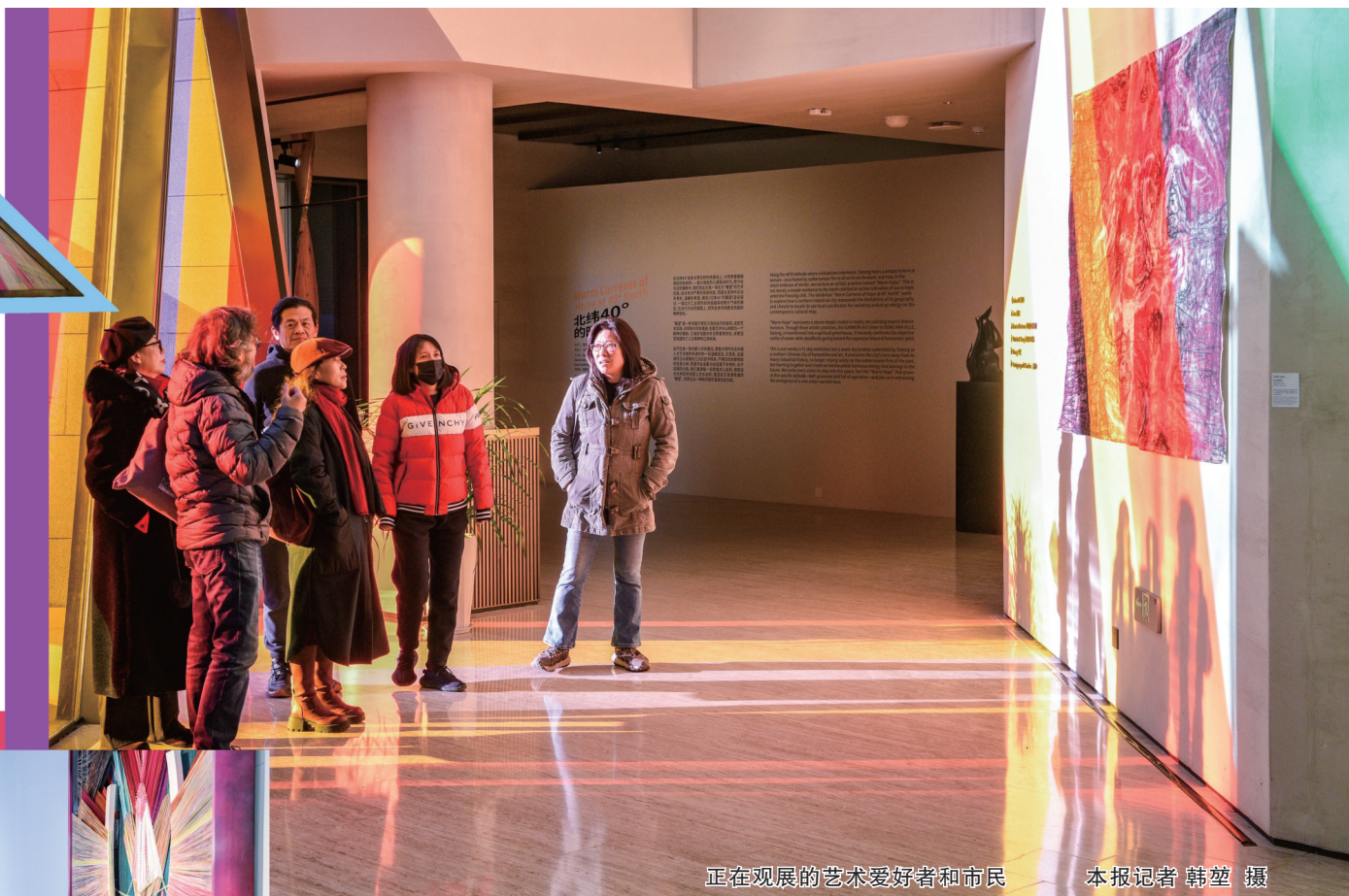
正在观展的艺术爱好者和市民