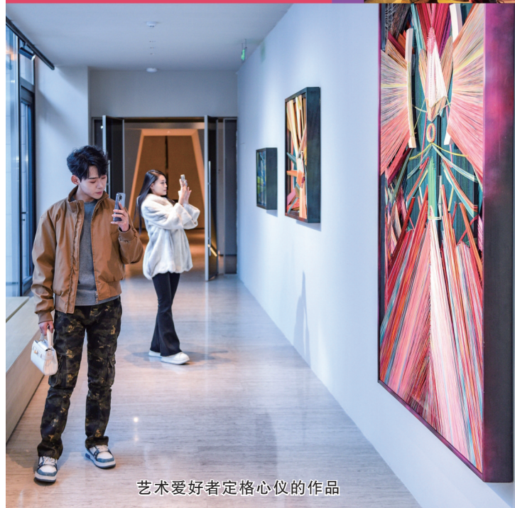
艺术爱好者定格心仪的作品