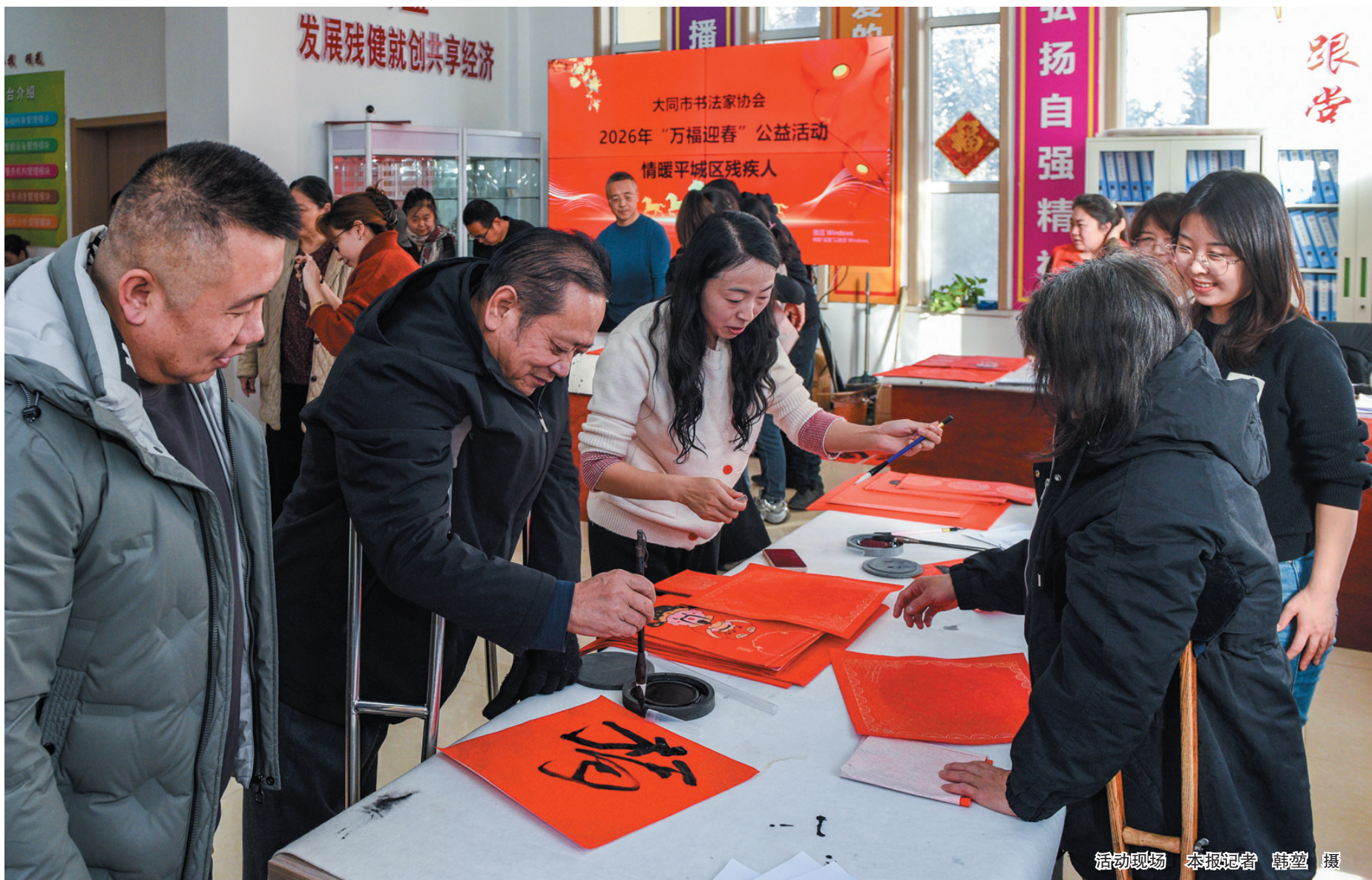
活动现场