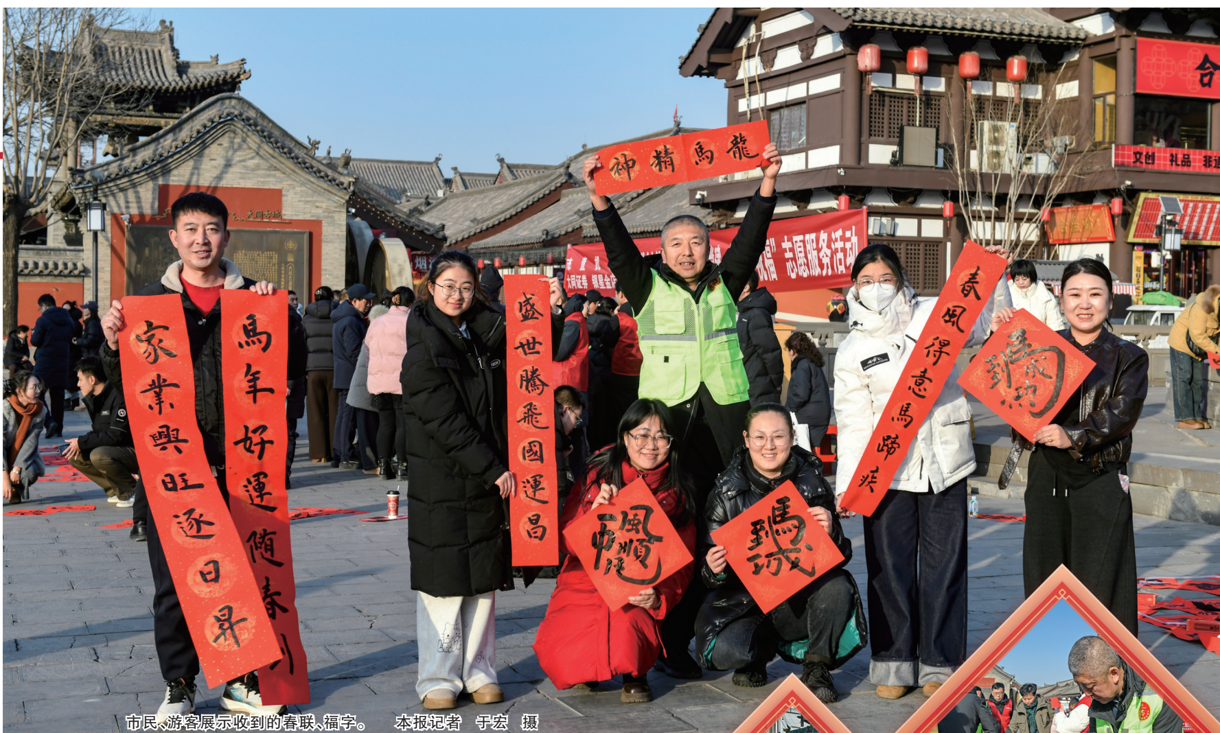
市民、游客展示收到的春联、福字。