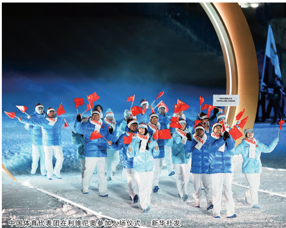
中国体育代表团在利维尼奥参加入场仪式