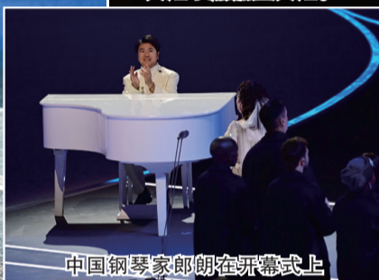
中国钢琴家郎朗在开幕式上

新华社米兰2月6日电 当地时间6日晚，第二十五届冬季奥林匹克运动会在意大利米兰开幕。这是意大利继1956年科尔蒂纳丹佩佐冬奥会、2006年都灵冬奥会后，第三次举办冬季奥运会。