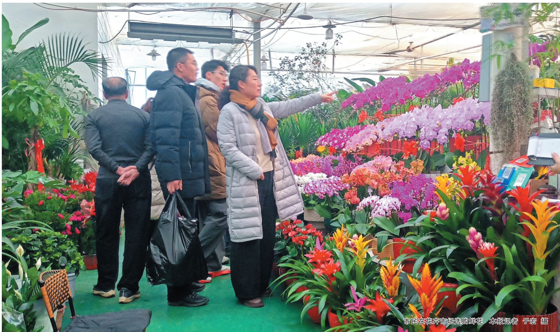
市民在花卉市场选购鲜花