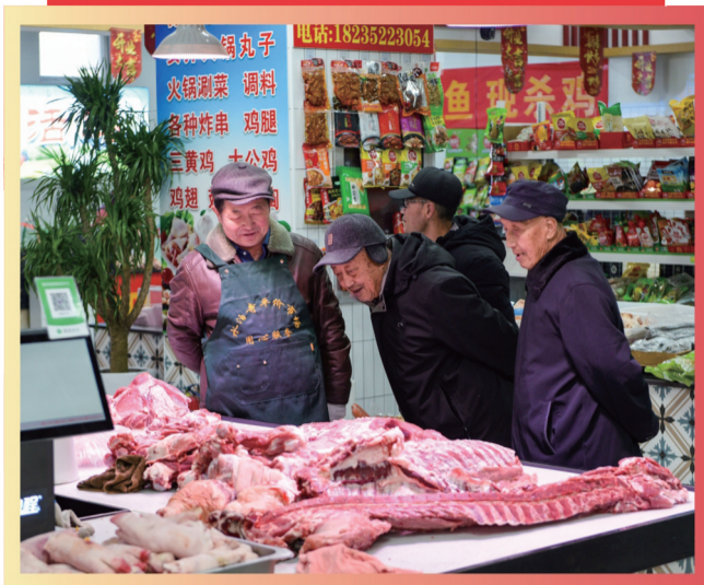
集贸市场内,鲜肉备货充足。