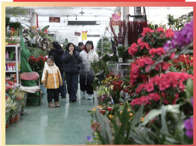
花卉市场内,市民穿梭于花海之间。

新春将至,大同古城处处洋溢着喜庆祥和的节日氛围,大街小巷年味浓郁,一派热闹欢腾的景象。