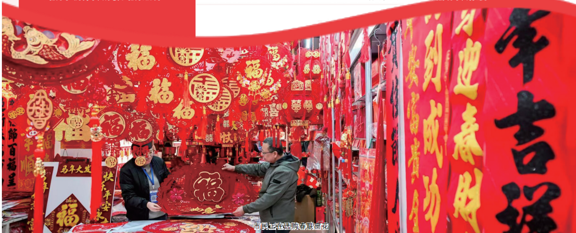
市民正在选购春联窗花