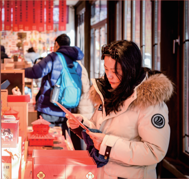
文创店内,马年文创产品受游客市民青睐。