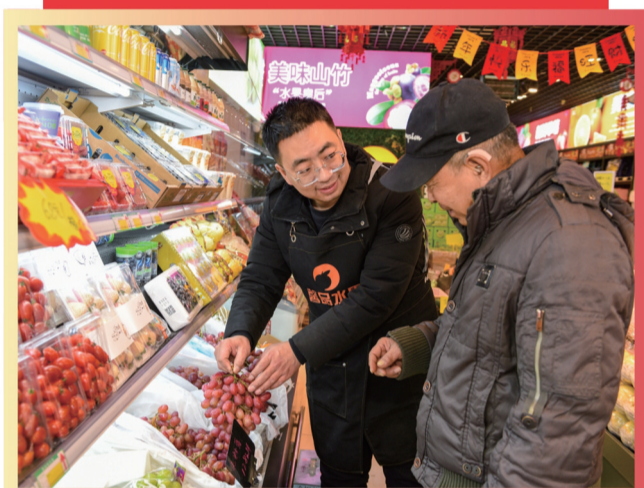
超市内,市民选购新鲜水果。