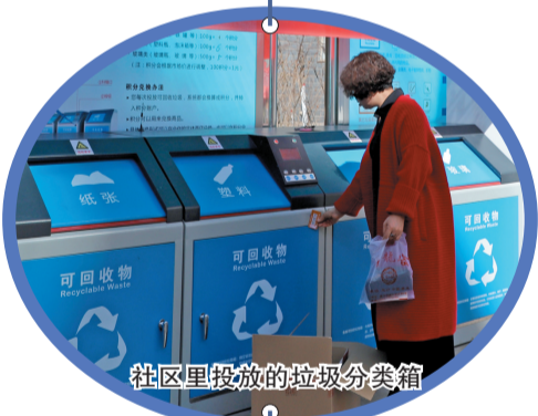
社区里投放的垃圾分类箱