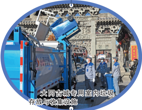
大同古城专用室内垃圾存放与收集设施

与此同时,相关部门将加快构建废弃物循环利用体系,促进形成绿色低碳的生产生活方式。日前,记者采访了相关行业负责人,就市民普遍关注的生活垃圾分类话题进行了政策解读。