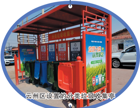
云州区设置的分类垃圾收集亭