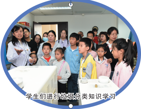
学生们进行垃圾分类知识学习