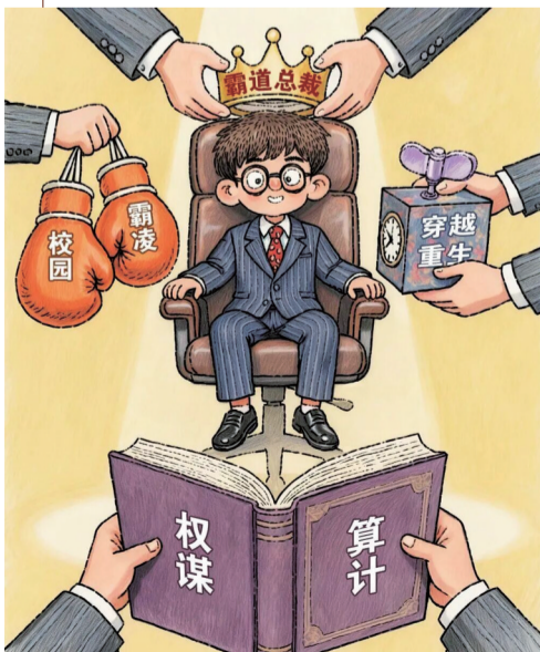
儿童类微短剧应杜绝这类糟粕！

近日，国家广播电视总局网络视听司发布相关儿童类微短剧管理提示，对儿童类微短剧创作中的成人化、工具化、娱乐化问题提出明确规范。