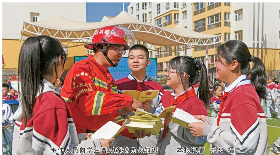
工作人员向学生普及森林防火知识

学附属小学御东校区,通过播放宣传片、开展知识问答等形式,向学生普及森林防火知识,并以“小手拉大手”的方式带动家长共同参与群防群治。在大同鹤山精煤有限责任公司活动现场,工作人员通过悬挂横幅、设置展板、现场宣讲等方式,向企业员工普及森林防火法律法规,明确野外违规用火的危害与责任。