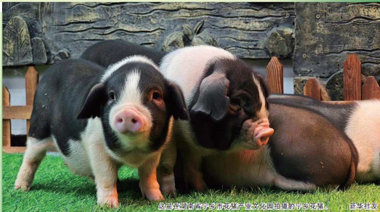
这是在湖南省宁乡市花猪产业文化园拍摄的宁乡花猪。

生猪市场目前形势如何？低价背后原因是什么？各方面应该如何应对？记者近日进行了调查。