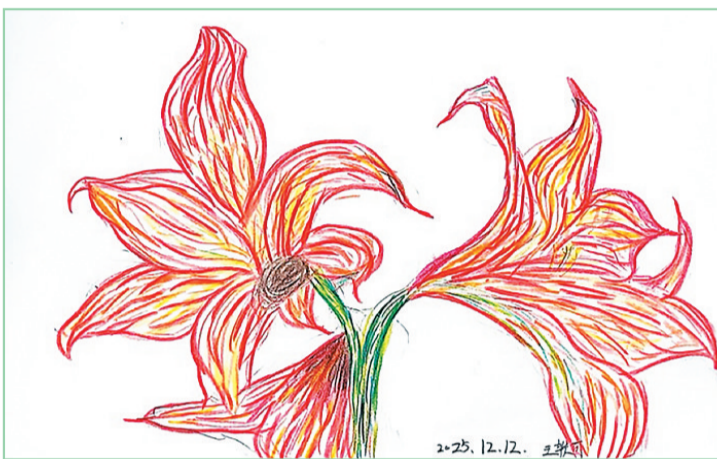
冬日花影 平城区文慧小学四(5)班 王轶可

这就是我最想推荐的动物园,一个充满欢乐与奇妙的地方。如果你也喜欢动物,一定要来这里看看,相信你也会和我一样,爱上这些可爱的动物朋友。