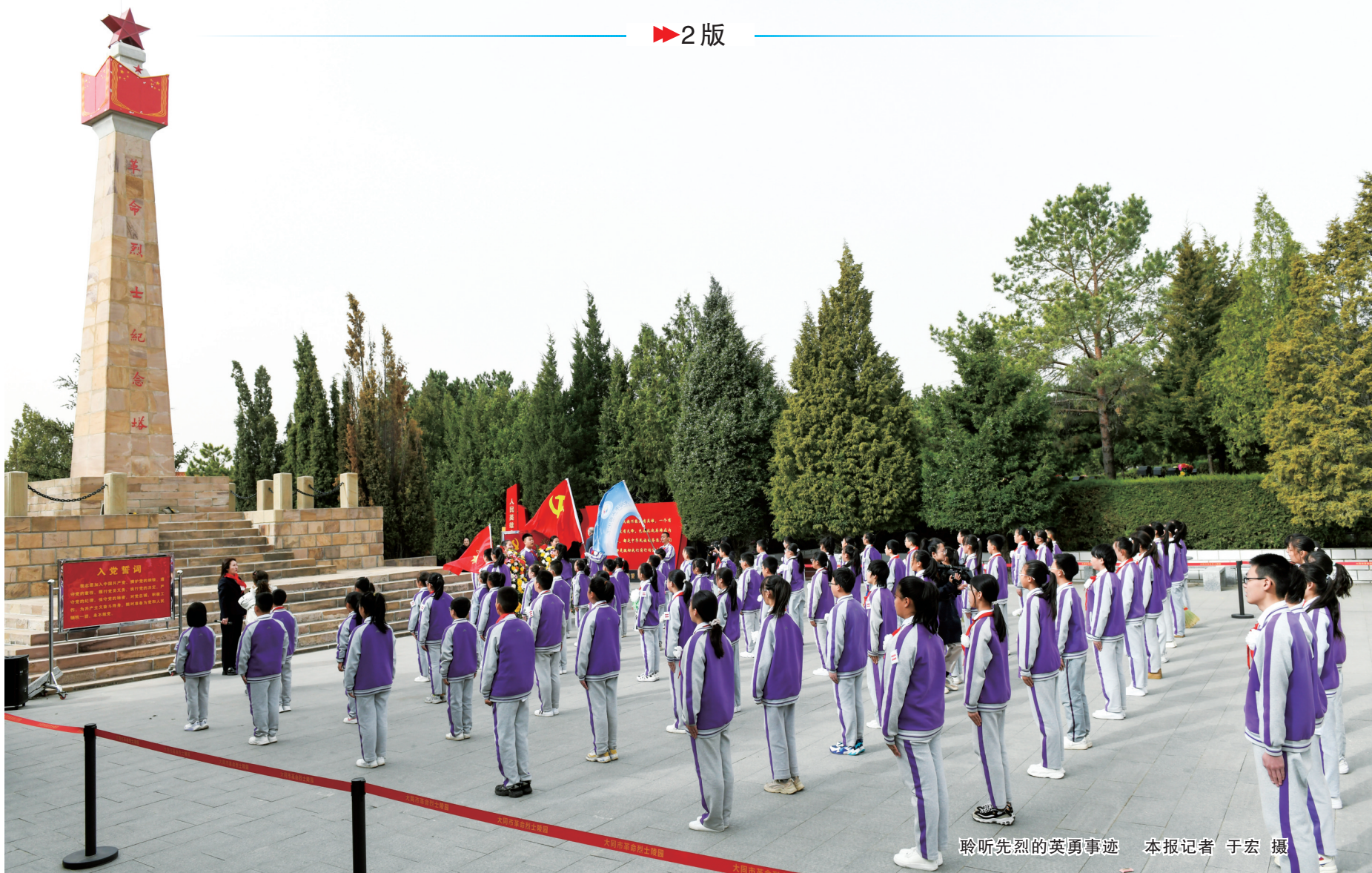
聆听先烈的英勇事迹