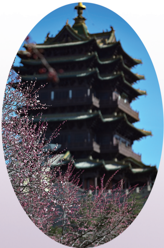
古塔新枝 一城芳菲