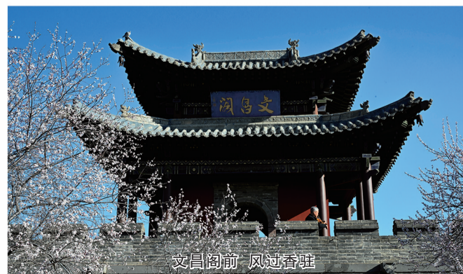
文昌阁前 风过香驻