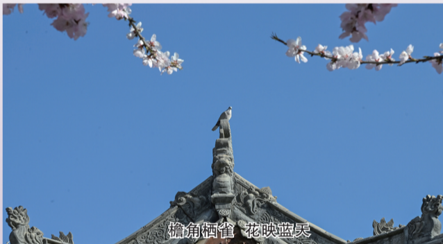
檐角栖霞 花映蓝天