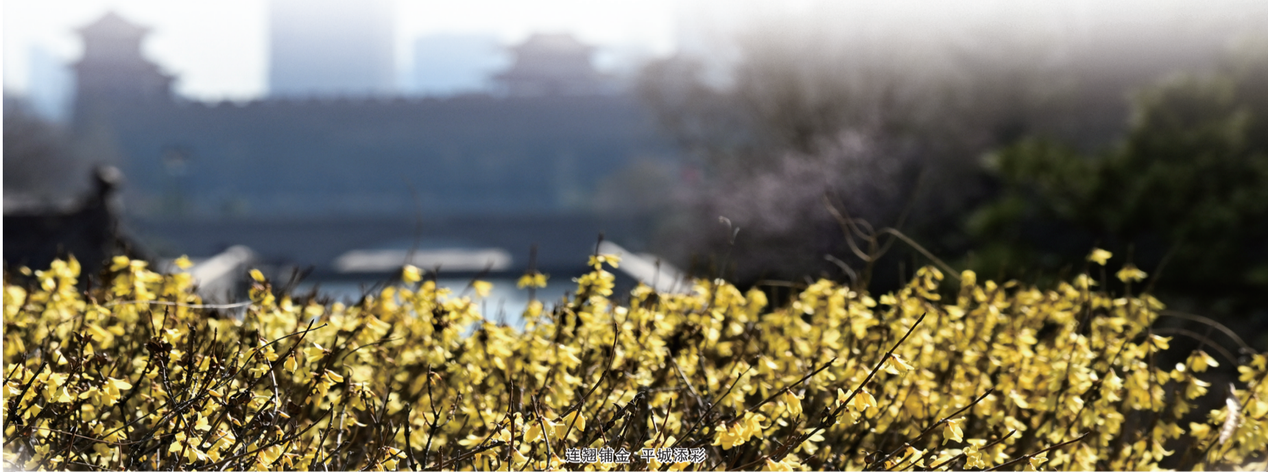
连翘铺金 平城添彩