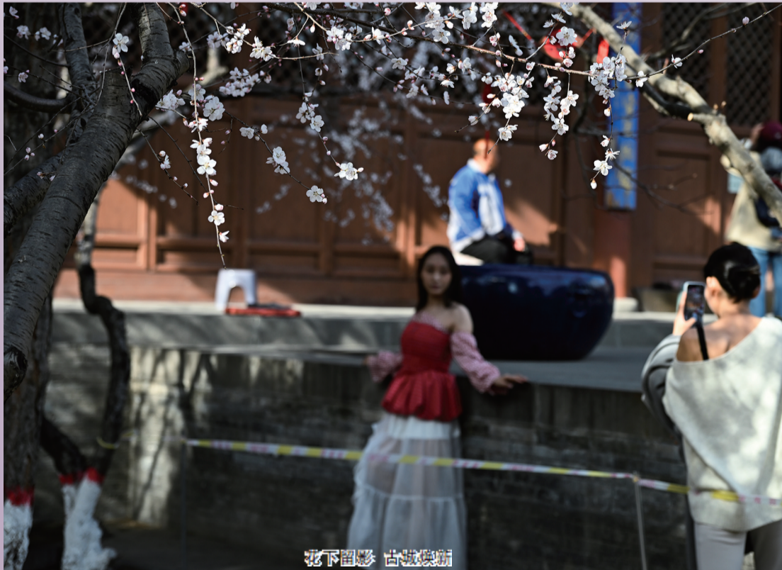
花下留影 古城焕新