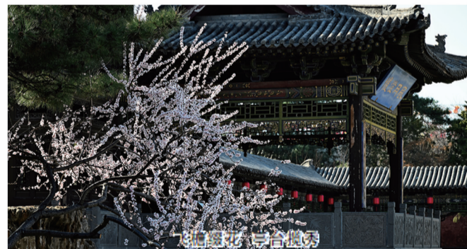
春风轻拂 亭台楼阁