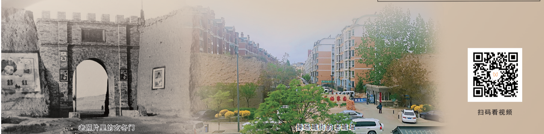
老照片里的玄冬门