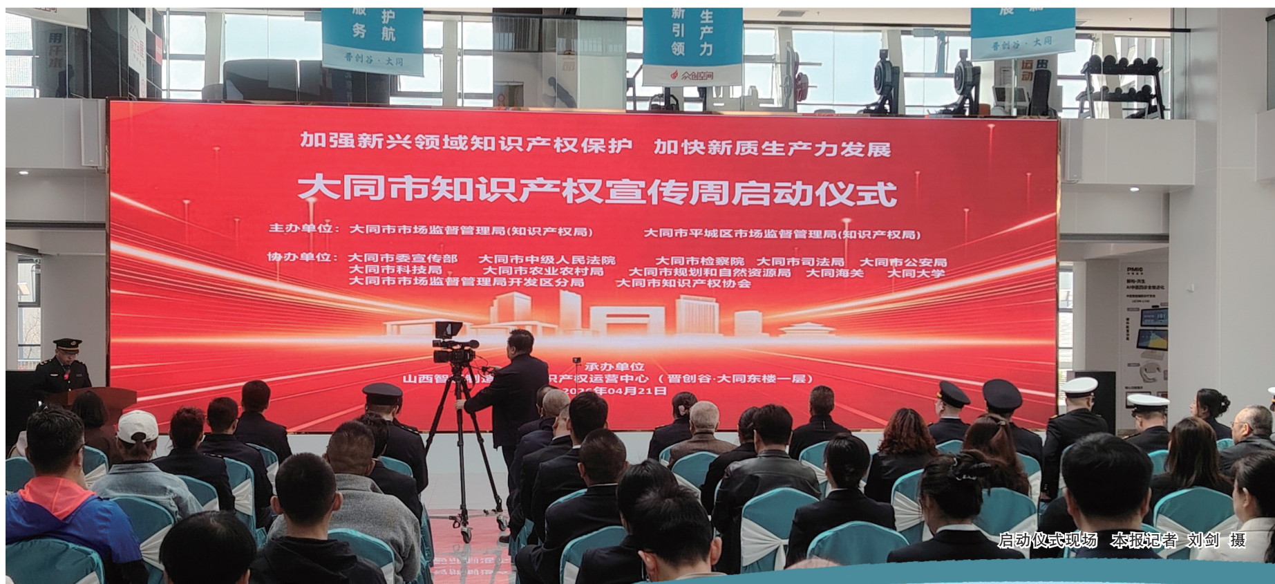
启动仪式现场