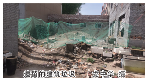
遗留的建筑垃圾

本报讯（记者 龙中华）“我们小区改造后，有一处拆除危墙的建筑垃圾没清理，使得环境凌乱不堪。”4月21日，平城区宋庄小区居民陈女士致电本报热线反映。