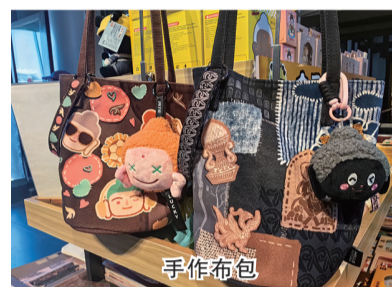
店内陈列的文创产品

在大同古城纯阳宫广场南侧，一家名为“大熊宝店”的文创小铺人头攒动。乍看店名，不少人误以为是“大雄宝殿”，看似调皮的“错别字”，究竟藏着怎样的设计巧思？