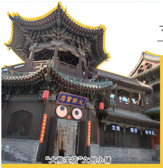
“大熊宝店”文创小铺