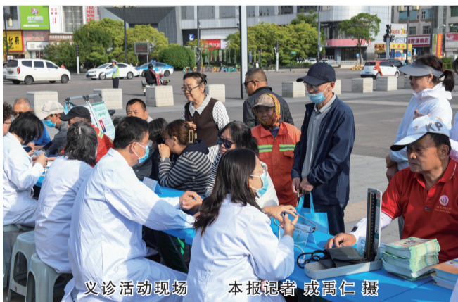
义诊活动现场

“我们秉承‘家门口的医养结合体，贴心健康主理人’理念，组建了8个家庭医生团队，服务1.3万余常住人口……”平城区武定街道社区卫生服务中心相关负责人说，此次活动通过义诊、解答健康疑问，讲解签约政策与服务、为有需求的居民现场办理签约手续