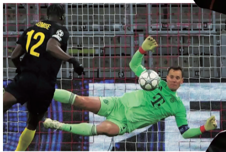
诺伊尔(右)在欧冠比赛中扑救

在前场人员选择上，德国媒体普遍认为，纳格尔斯曼既看重球员状态，也看重球员在特定战术场景下的功能。格纳布里因伤无缘世界杯，接替入选的穆西亚拉虽然重伤复出不久、状态尚未完全恢复，但仍被视为能够凭借几次关键处理改变比赛走势的球员。萨内入选则与其在国