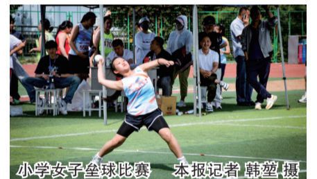
小学女子垒球比赛

本报讯(记者 丁亚琴)近日,2026年平城区中小學生田径运动会开赛,集中展现新时代平城少年朝气蓬勃、奋发向上的精神风貌。