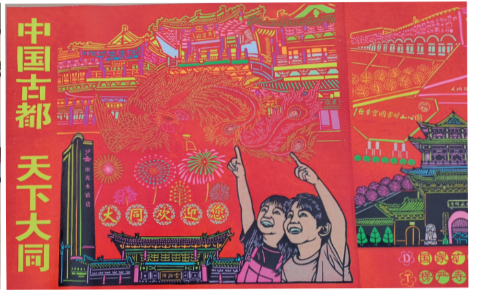
剪纸长卷一部分

矿国家矿山公园、大同市博物馆、文瀛湖风景区、山西大同大学、南环桥等现代地标,彰显城市发展新貌;下方以黑色蜡光纸刻画云冈石窟、华严寺、悬空寺、九龙壁等历史古迹,尽显千年古都厚重文脉,同时融入平型关红色地标、火山生态景区、特色乡村等元素;卷尾为我市最大河流桑干河,寓意润泽一方水土、守护古都文脉。