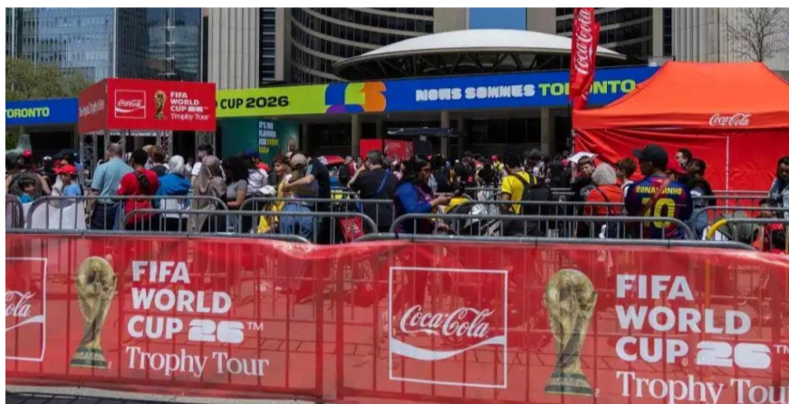
5月26日，在加拿大多伦多市政广场，人们排队等候参观原版国际足联世界杯奖杯（“大力神杯”）。

在大赛中经常引发话题的英格兰队，在世界杯开始前就出了大新闻：主教练图赫尔弃用了福登、帕尔默、阿诺德等大牌球星，外界普遍以状态为由解读多名球星落选，可出勤有限的斯通斯顺利入选，进一步放大舆论质疑。