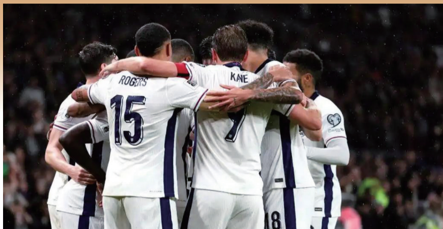
2025年11月13日，英格兰队球员在在英国伦敦举行的2026年美加墨世界杯欧洲区预选赛中庆祝进球。

围绕巴西大名单的另一个问题是佩德罗的落选。这位切尔西前锋本赛季在英超联赛中发挥出色，参与进球数超过绝大部分竞争者。有媒体分析，从技术特点来说，佩德罗在这支“桑巴军团”并非绝对不可替代，而且他在国家队8场比赛0球0助攻的表现也着实拉低了他在安切洛蒂心中的顺位。即便如此解释，很多人还是为状态正佳的佩德罗落选感到遗憾。