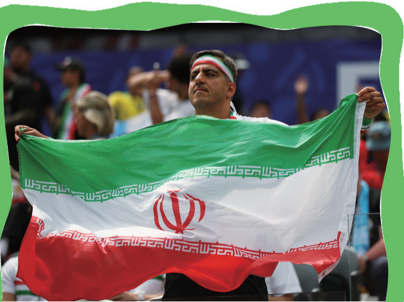
当地时间6月21日，在美国洛杉矶进行的G组小组赛中，比利时队0:0战平伊朗队。