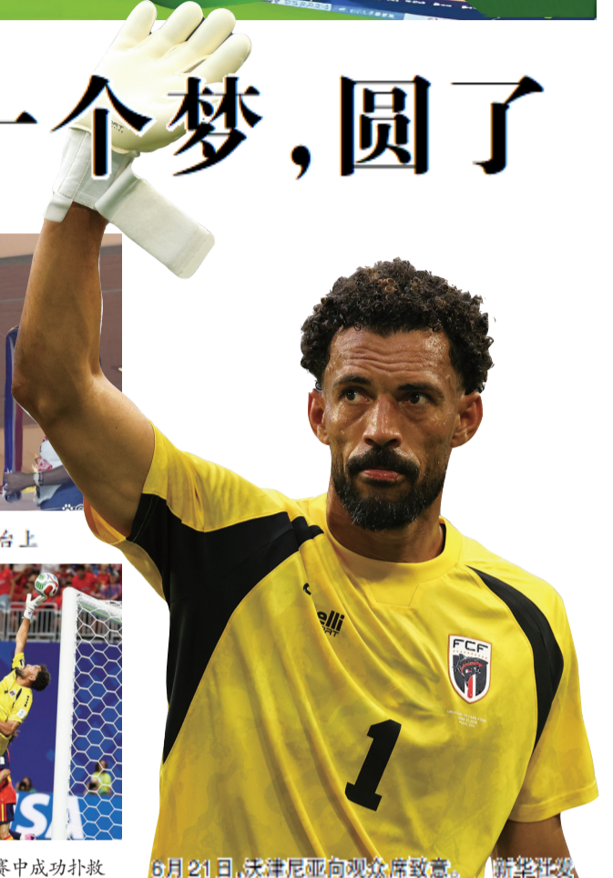
6月21日，沃津尼亚向观众席致意。