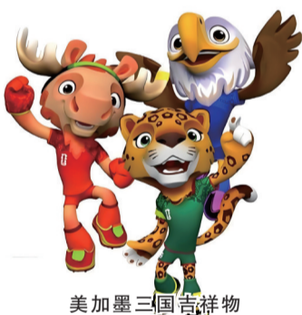
美加墨三国吉祥物

目前阿根廷队以6分位列J组头名，已锁定一个32强席位。27日，他们将在小组赛末轮对阵约旦队。梅西表示，希望以全胜战绩晋级。“我们是阿根廷队，无论面对哪个对手，我们总是力争胜利。”