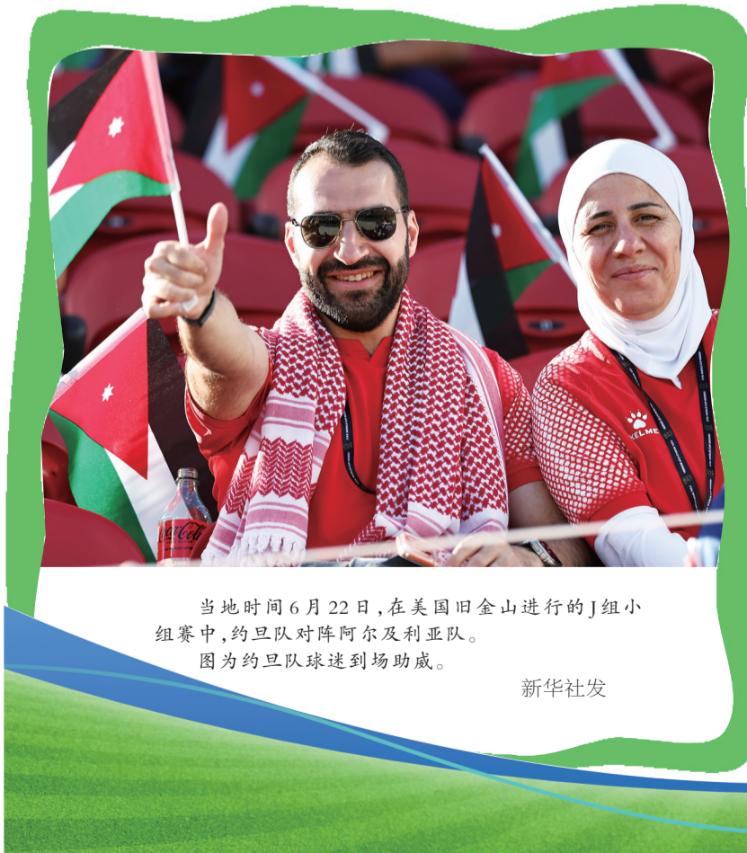
当地时间6月22日，在美国旧金山进行的J组小组赛中，约旦队对阵阿尔及利亚队。图为约旦队球迷到场助威。