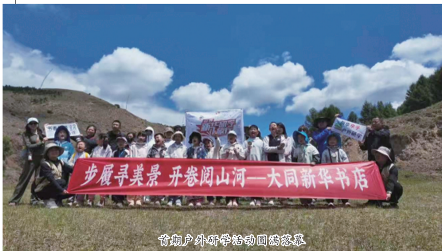
首期户外研学活动圆满落幕

6月初，大同新华书店全新自主研发的“亲子徒步”研学课程顺利落地并圆满开展。本次课程以“山野无痕 成长有迹”为核心主题，聚焦自然教育与亲子陪伴，邀请14组家庭作为首期体验官，开启了一场沉浸式山野研学之旅，让家长与孩子携手走进自然、亲近自然、感悟自然。