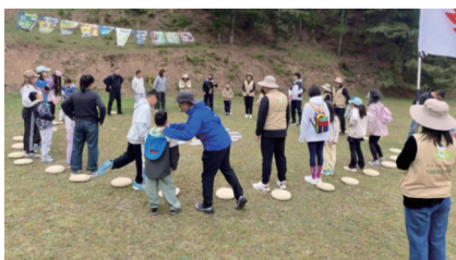
丰富多彩的亲子协作游戏