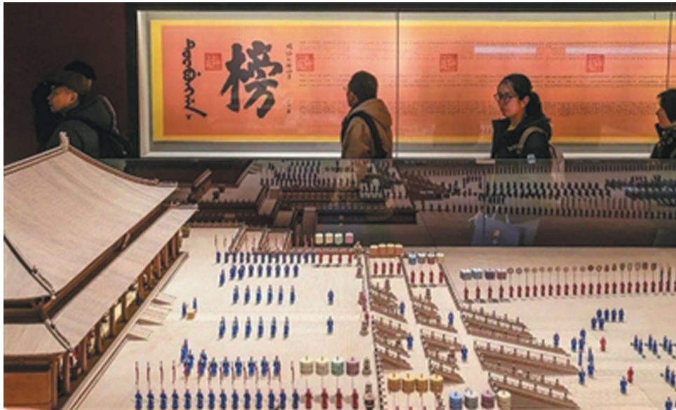
观众在同治七年的“金榜”复制品前驻足

从隋朝大业元年(605)正式创立,到清朝光绪三十一年(1905)废止,科举制度延续了整整1300年,共选拔出进士十余万人,举人、秀才数以百万计。它不仅是无数读书人改变命运的独木桥,更是中华文明维系千年不坠的制度根基。今天,当我们为高考学子加油鼓劲时,不妨推开历史的贡院大门,走进那场决定无数人命运的“天下大考”。