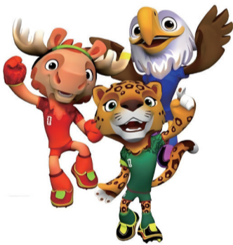
美加墨三国吉祥物