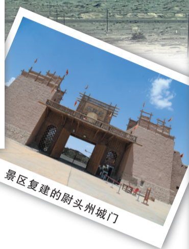
景区复建的尉头州城门