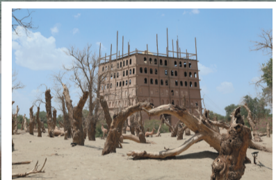
景区内修建的城堡