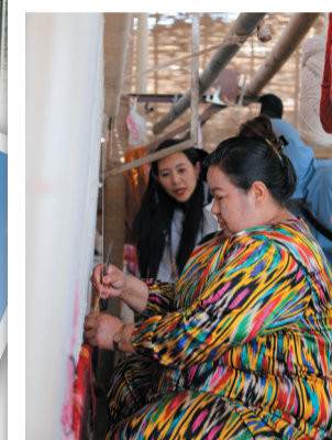
当地居民展示艾德莱斯绸纺织技艺